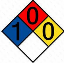
Rombo NFPA 704